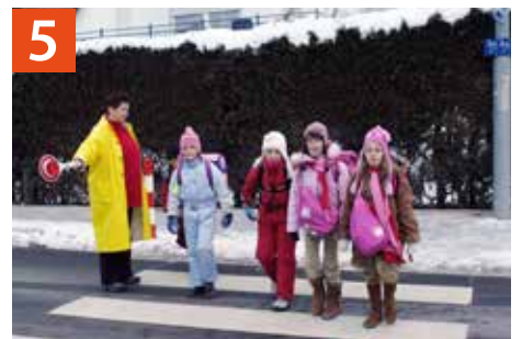
5 Fußgängerüberweg Wasserturmstraße/Höhe Reisingerstraße