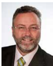
Alexander Greulich 1. Bürgermeister

Die Herausgeber dieses Schulwegplanes, der Landkreis München und Ihre Wohnsitzgemeinde sowie Ihre Schule und die Elternbeiräte, wünschen allen Schulkindern einen stets unfallfreien Schulweg!