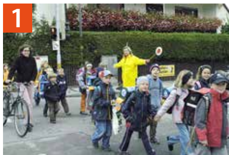
1 Fußgängerampel Münchener Straße/Schloßstraße