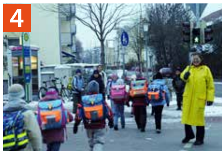
4 Fußgängerampel Münchener Straße/ Wasserturmstraße