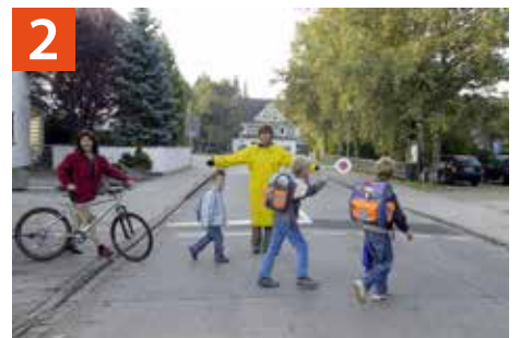
2 Fußgängerampel Dr.-Schmitt-Straße