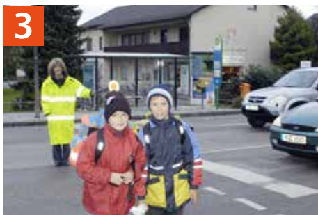
3 Fußgängerampel Münchener Straße/ Bahnhofstraße/An der Isarau